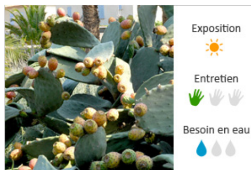
Figuier de barbarie

Un arbuste aux feuilles vertes pâles, à faible besoin en eau, sur un balcon au climat méditerranéen :